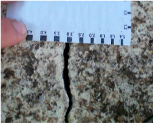
Mesura puntual d'amplària d'esquerda. No permet determinar-ne el moviment