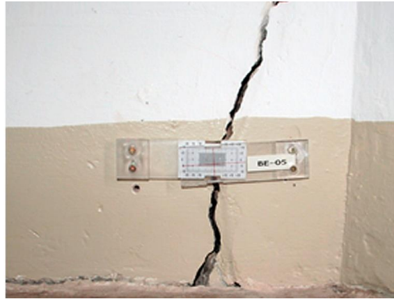
Instrumentació amb fisuròmetre