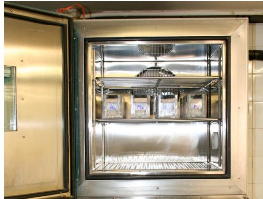
Cambrà climàtica amb els permeàmetres