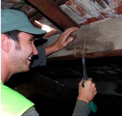
Extracció de la mostra amb serra i enfornador