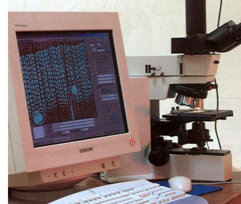
Observació amb microscopi

A partir d'una mostra de fusta de reduïdes dimensions ( \geq 2 \times 2 \times 2 cm) es procedeix al tall de làmines fines i s'observen amb microscopi. L'estructura de la fusta és característica de cada espècie, la qual cosa permet identificar-la. Serveis fustes